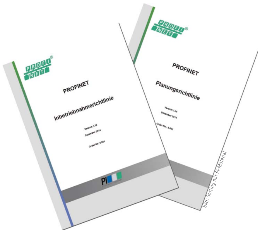
Bild 3: Das Standardisierungsgremium PI unterstützt die Anwender mit umfangreichen Richtlinien zur Planung und Inbetriebnahme von Profinet-Netzen.

Es ist bemerkenswert, wie unterschiedlich Profinet-Anwender derzeit auf diese organisatorischen Fragen antworten und wie unterschiedlich Verantwortlichkeiten und Aufgaben diversen Rollen zugeordnet sind. Selbst innerhalb eines Unternehmens lassen sich bisweilen erhebliche Unterschiede von Produktionsstandort zu Produktionsstandort feststellen. Weithin unbestritten ist die herausgehobene Rolle der Instandhaltung. Diese ist für den First-Level-Support der gesamten Anlage verantwortlich, die nun auf Profinet aufsetzt. Instandhalter benötigen Prozesse und geeignete Werkzeuge, damit sie im Hinblick auf das Netz nicht im Blindflug unterwegs sind. Gleichzeitig ist es weder notwendig noch praktikabel, dass sich jeder Mitarbeiter der Instandhaltung in einen IT- und Kommunikationsexperten verwandelt, der etwa einen internen Fehler im Protokoll-Stack des Geräteherstellers aufspüren und nachweisen kann.