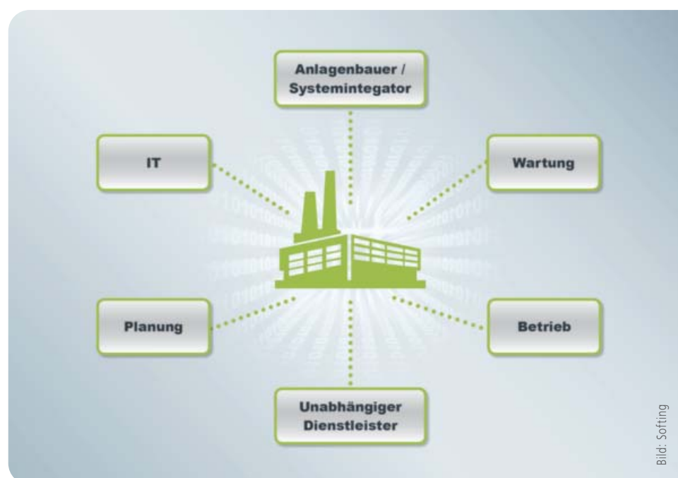
Bild 2: Potenziell Beteiligte an der Diagnose eines Profinet-Netzes. Wer übernimmt welche Aufgaben?